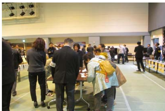
合同公売会の様子

なお、今後はインターネット公売（ヤフージャパンの官公庁オークション）に出品する方法でも差し押さえた動産の公売を行う予定です。（インターネット公売は全国の公共団体等が出品していて、どなたでも参加できます）