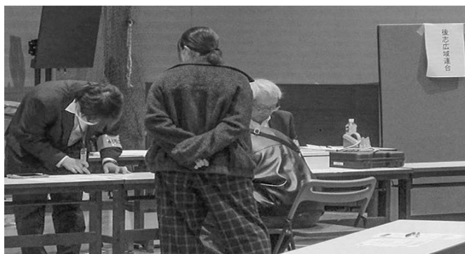
合同公売会の様子