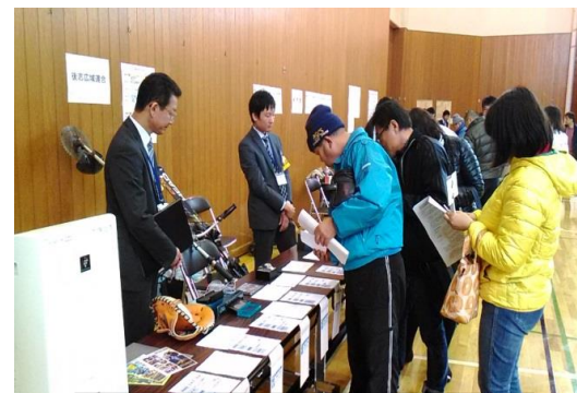
北海道地方税等合同公売会

インターネット公売は全国の公共団体等が出品していて、どなたでも入札に参加できます。